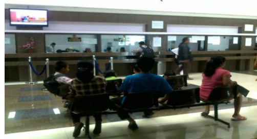
Gambar 2 Loket antrian tiap kecamatan (gambar diambil 19052011)

Untuk menjalankan tugas pelayanan kartu tanda penduduk bagi masyarakat kota Malang, dispendukcapil mempunyai beberapa pegawai yang mengerjakan tugas-tugas pelayanan sesuai pembagiannya masing-masing, serta dibantu dengan alat-alat pendukung pekerjaan dalam proses pelayanan sehingga dapat dikerjakan secara cepat.